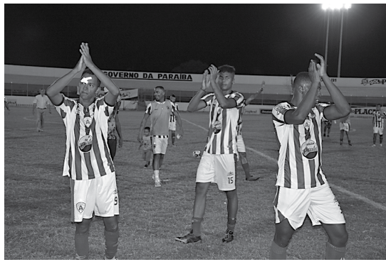
Atlético de Cajazeiras comemora vitória por 1 a 0 sobre o Serrano e retorna à vice-liderança do Paraibano

O Sousa foi outro time sertanejo que foi bem nos jogos da última quarta-feira. O clube vinha na lanterna, e sem vencer nenhum adversário até o momento. Mas se aproveitou de duas falhas in-críveis da defesa do CSP e ganhou por 2 a 0, em João Pes-