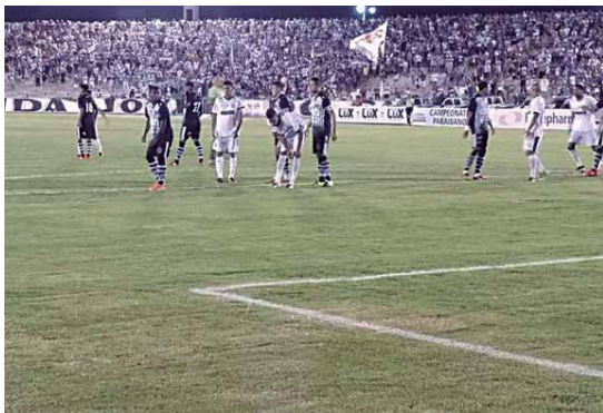
A partida ocorreu no Estádio Amigão, em Campina Grande e foi prestigiada por um grande público