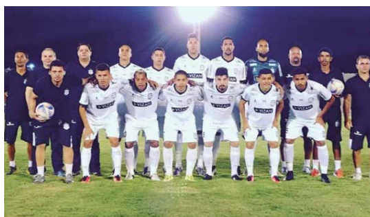
Aderda fez com que o Treze caísse para a terceira colocação na tabela de classificação do Campeonato