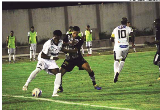
As equipes fizeram um jogo muito truncado, cada um esperando o momento exato para ir ao setor ofensivo