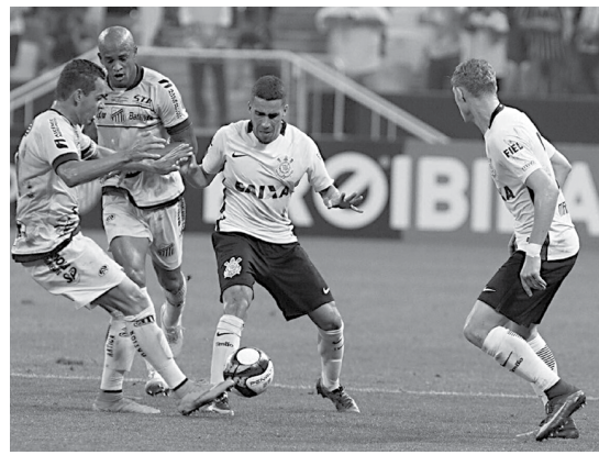
Na partida em que venceu o Novorizontino, pelo Estádio, o público de 11.708 torcedores não era o esperado