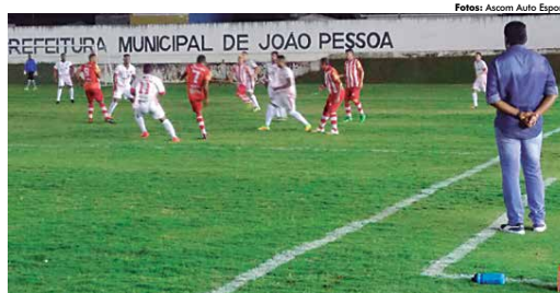
As duas equipes jogaram no CT Van Traz, no Valéria Figueiredo, na capital, e não abriram o marcador